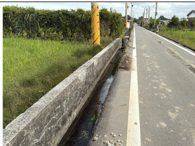
說明：工區 4-1 緊鄰交通頻繁道路，路面已有部分破損。