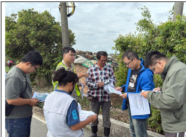
說明：主辦生態團隊說明本案生態情資及工區現勘結果。