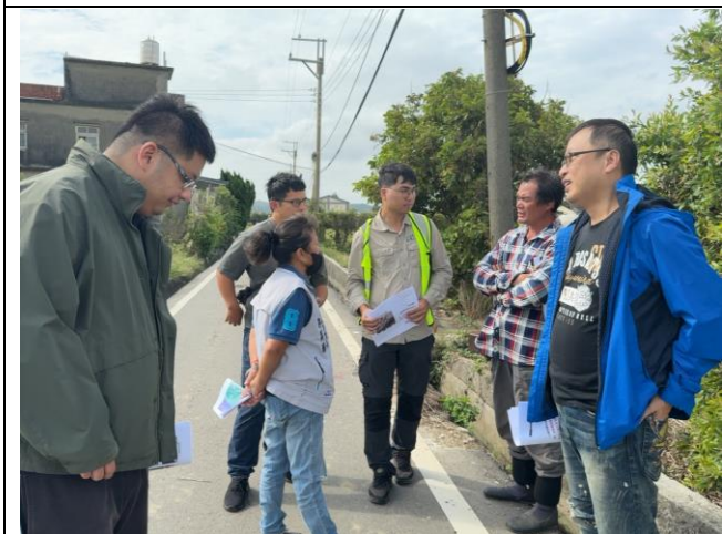
說明：郭里長及張小組長均表示，工區 4-1 附近未曾聽過有石虎或彩鷓出現。