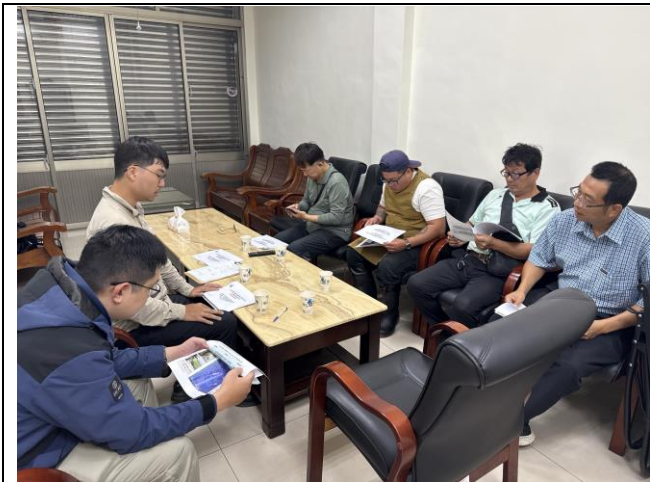
說明：主辦生態團隊說明本案生態情資及工區現勘結果