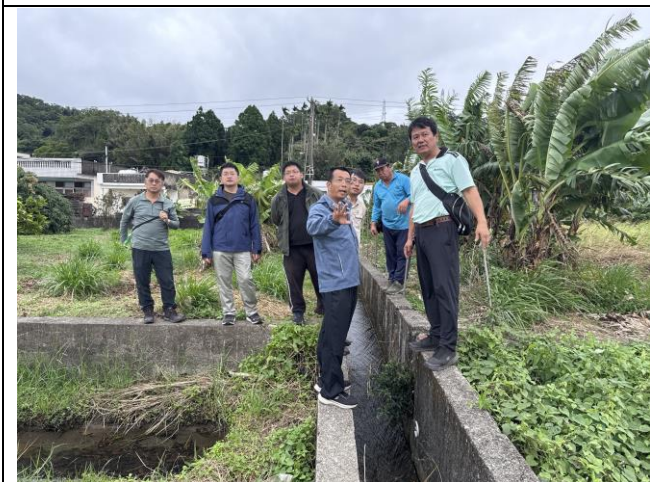
說明：與會者至工區 2-3 進行現場勘查及討論