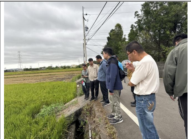
說明：與會者至工區 2-2 進行現場勘查及討論