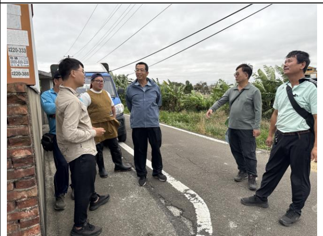
說明：苗栗自然生態學會李理事長提供關於石虎等生態相關意見