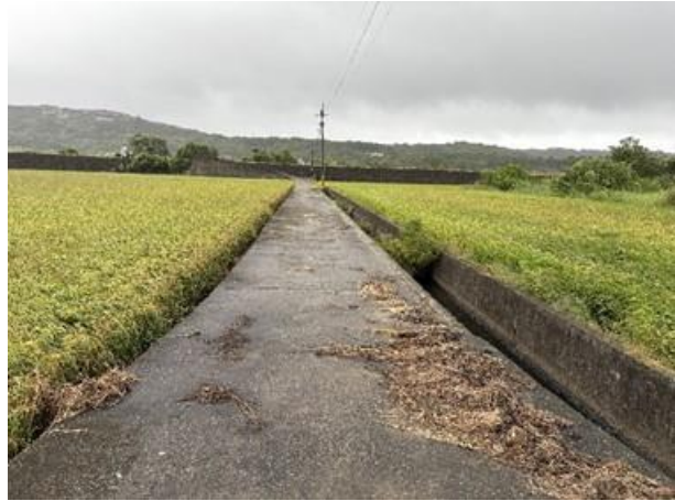
預定工區周邊環境現況。